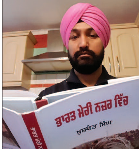
ਮੋਟੇ ਕੰਮਾਂ ਕਾਰਾਂ ਵਿੱਚ ਇੰਗਲਿਸ਼ ਦੀ ਮੁਸਕਿਲ ਪੈਂਦੀ ਤਾਂ ਕਵੀ ਜੀ ਮੱਦਦ ਕਰਦੇ। ਦੂਰ ਨੇੜੇ ਆਉਣ ਜਾਣ ਵੇਲੇ ਕਵੀ ਜੀ ਗੱਡੀ

ਵੀ ਛਕ ਲੈਂਦਾ ਤੇ ਆਪਣੀਆਂ ਕਵਿਤਾਵਾਂ ਸੁਣਾਉਣ ਦੀ ਲਲਕ ਵੀ ਪੂਰੀ ਕਰਦਾ। ਭਾਈਆਂ ਦੇ ਆਪਣੇ ਮਤਲਬ ਹੁੰਦੇ, ਨਿੱਕੇ